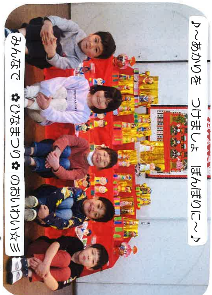
♪～あかりを つけましょ ほんほりに～♪