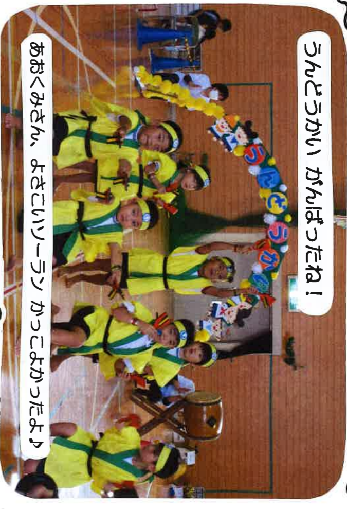
おおくみさん、よさこいハイラン かつこよかったよ!